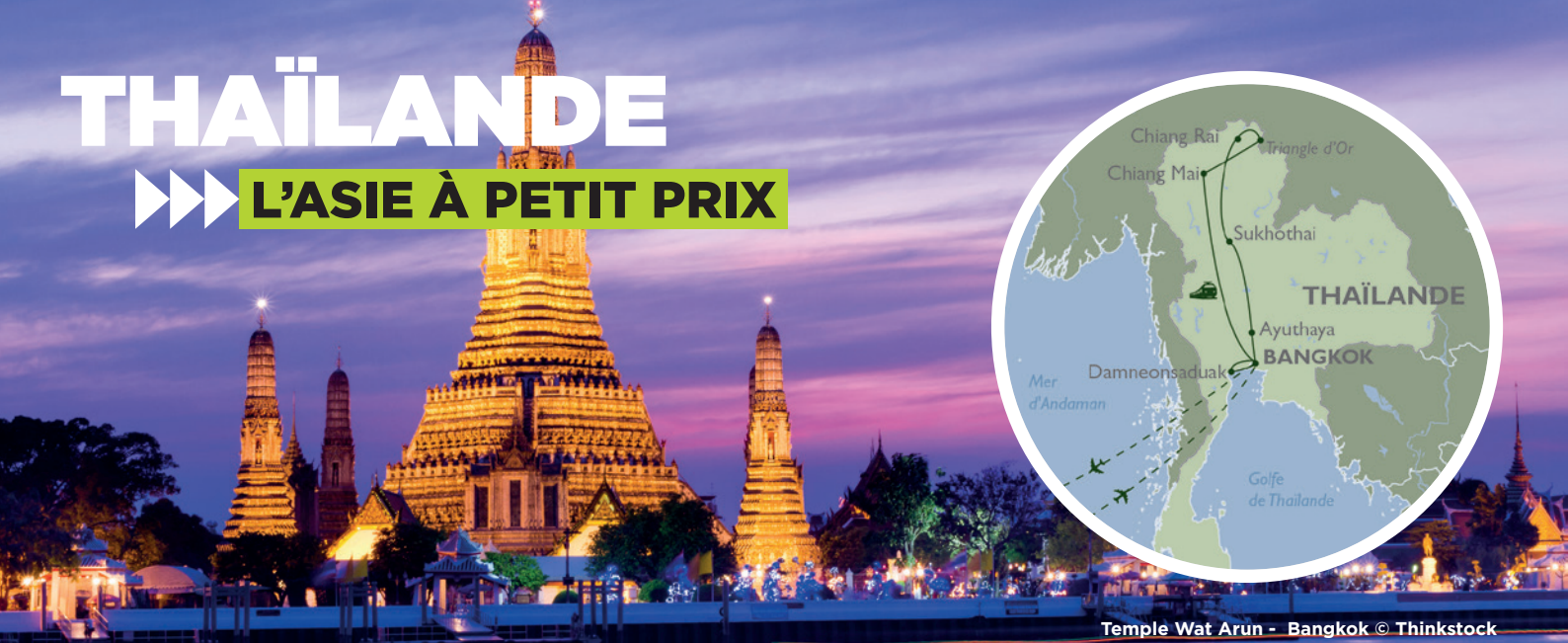
Temple Wat Arun - Bangkok